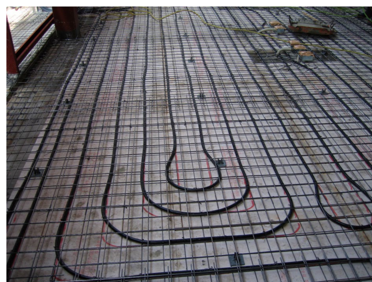
店舗と整備工場に蓄熱式床暖房を採用し、快適な店舗を実現