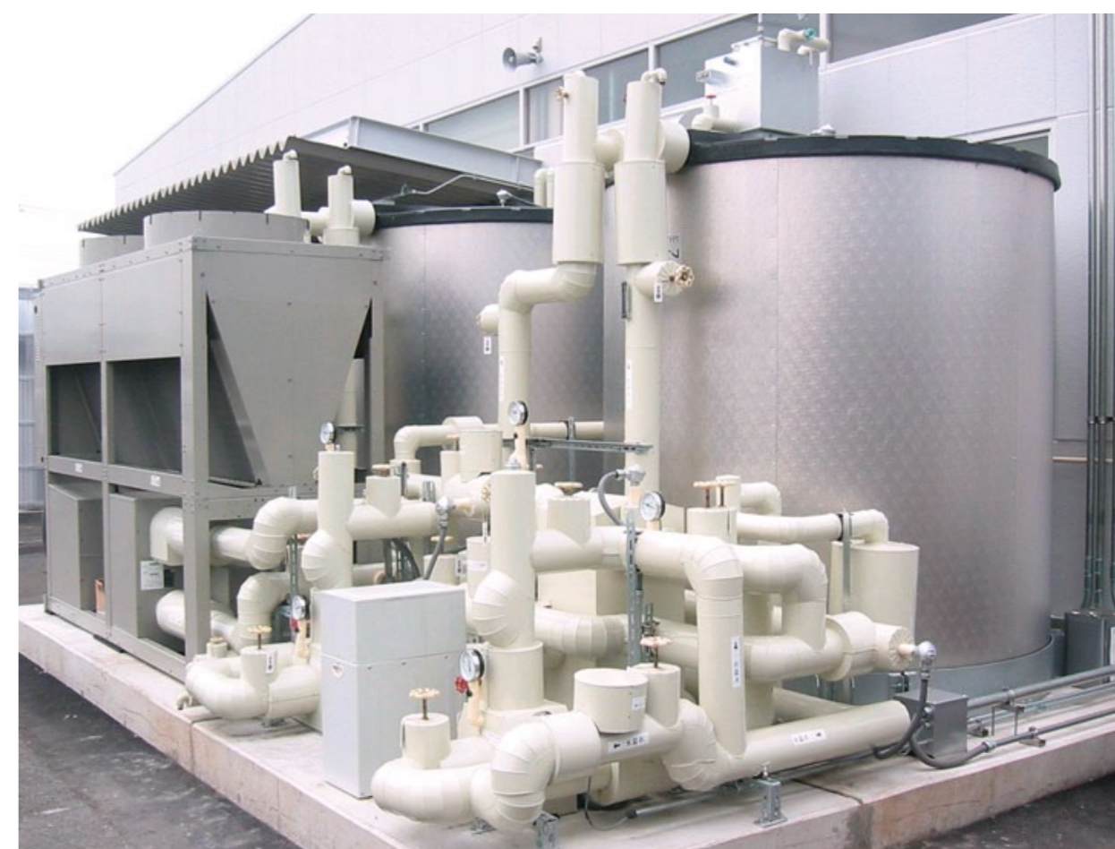
熱源システムに氷蓄熱システムを採用