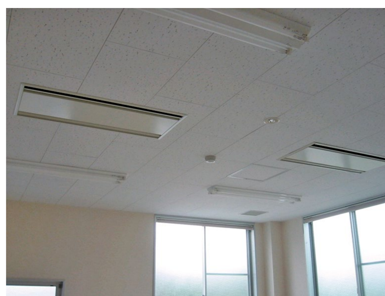
ファンコイルの大温度差化で高効率な空調運転