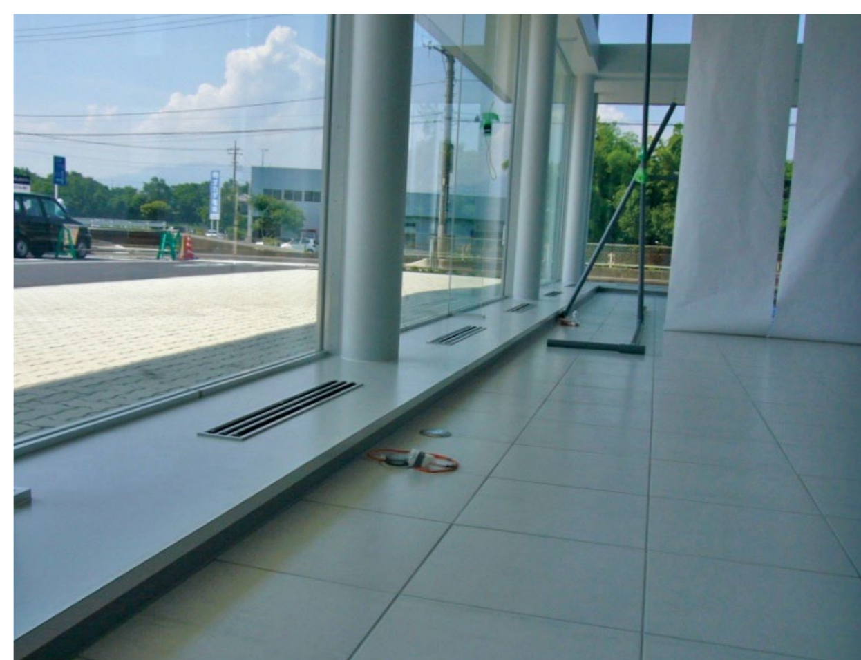
ファンコイルの大温度差化で高効率な空調運転