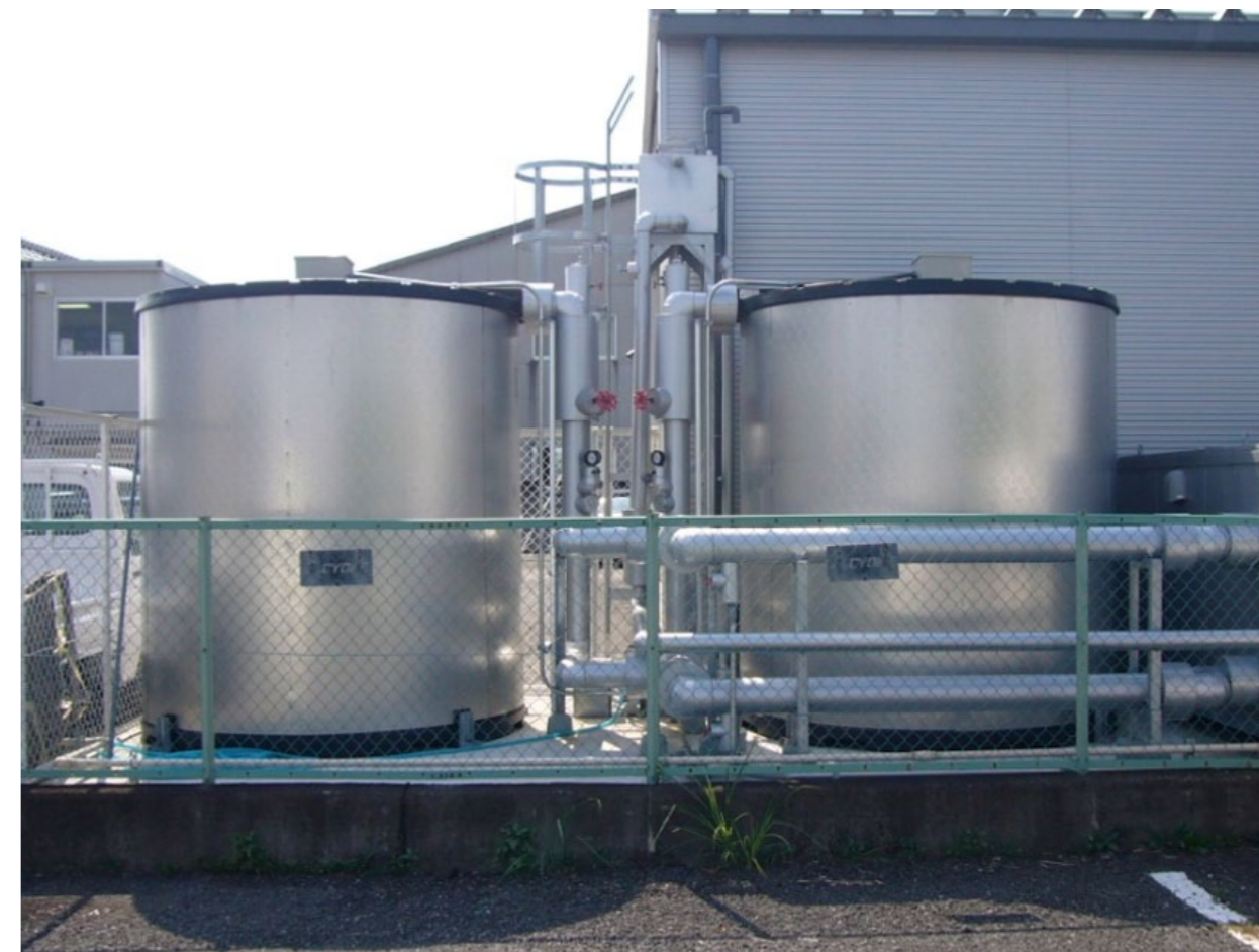
熱源システムに氷蓄熱システムを採用