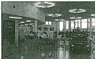
夜間電力を使った蓄熱システムに加えフロアには床暖房を導入した

スも確保した。店内中央部のシンボルマークの設置や構造、備品などはメーカー基準に沿った。同店は全国のモデル店となる。