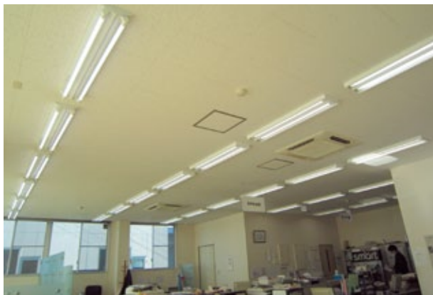
LEDの最大の利点は、消費電力が少なく、寿命が長いこと、そのため、電気代を大幅に削減できるのももちろん、設備の交換の頻度が劇的に減り、メンテナンスコストも削減できます。【一役事務所】(前橋市役所)