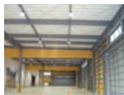
(株)太陽運輸新倉庫